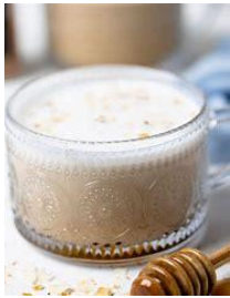
A LA MIEL