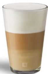
LATTE MACCHIATO (LECHE MANCHADA)

Latte Macchiato significa literalmente " leche manchada " en italiano. La leche caliente y la espuma de leche cremosa absorben el delicioso sabor del café con un resultado espectacular y suntuoso. ¡Un placer para todos los gourmets!