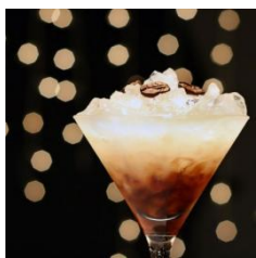
HOT & SWEET