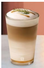
CARAMELO SIN FIN