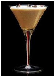
CÓCTEL DEL CAFÉ