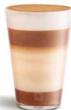
DULCE DE LECHE MACCHIATO

El dulce de leche baila artísticamente al combinarlo con una leche cremosa y magistralmente espumada.